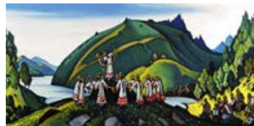
Н. Рерих. Эскиз к балету «Весна священная»