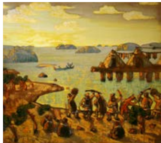
Н. Рерих. Призыв солнца