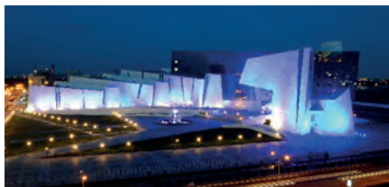
2-сурет. Астана қ. Ұлттық мұражай