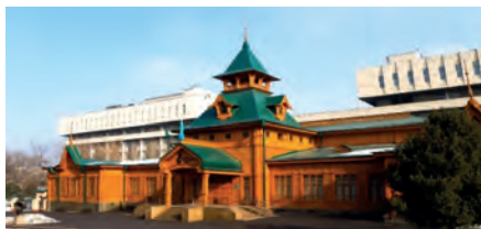
3-сурет. Алматы қ. Қазақ халық музыкалық аспаптар мұражайы

• Әдебиет және кітапхана – Қазақстан кітапханаларының бірегей көне басылымдарын, сирек кездесетін кітаптарды, көне қолжазбалар мен манускрипты қоса алғанда, кітаптар және кітапхана материалдары,