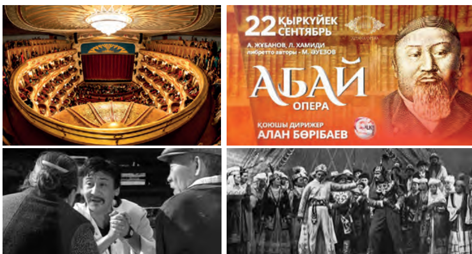
1-сурет. Театр, музыка және хореография өнері бөлімі