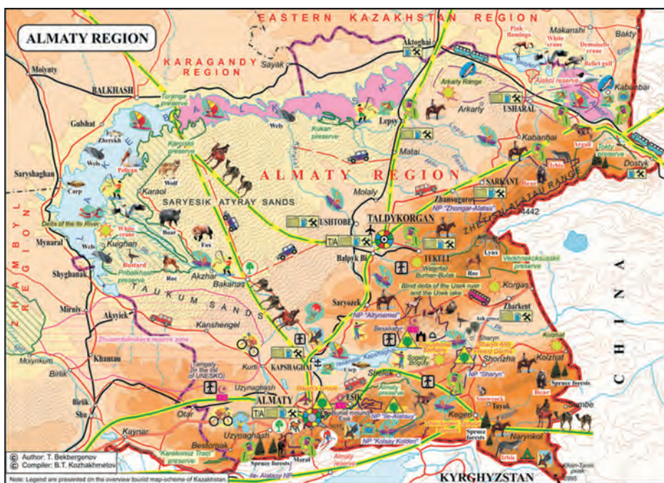
5-сурет. Ұлы Жібек жолы солтүстік дала учаскесінің картасы.

Ерекше қорғалатын табиғи аумақтар, маршруттар, соқпақтар, тұрақтар, қарау алаңдарының орналасқан сызбаларын, жоспарларын, карталарын шығару «жібек артериясының» қазақстандық учаскесін туризм үшін жергілікті көне көшпенділердің және олардың қазіргі ұрпақтарының салт-дәстүрін және тұрмысын, тарихын, мен мәдениетін, археологиясын кешенді түрде толық көрсетуге мүмкіндік береді.