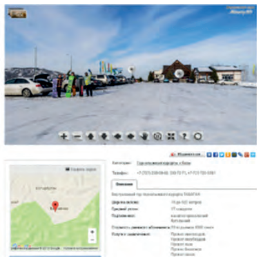
4-сурет. Объектінің орналасқан жерін көрсете отырып, «Табаған» тау шаңғысы курортының 3D туры.

Келесі жұмыс кезеңі GPS аспаптарының көмегімен координаттар бойынша жұмыс картасына оларды байланыстыруға және жергілікті жердегі объектілерді картографиялауды қамтиды. Виртуалды карталардың визуалдауын жақсарту мақсатында бейнетурлар арнайы сайтында орналастыруға арналған, айналмалы панорамалық түсіру қолданылады, суретті шерткен соң терезесінде 3D тур ашылады (4-сурет).