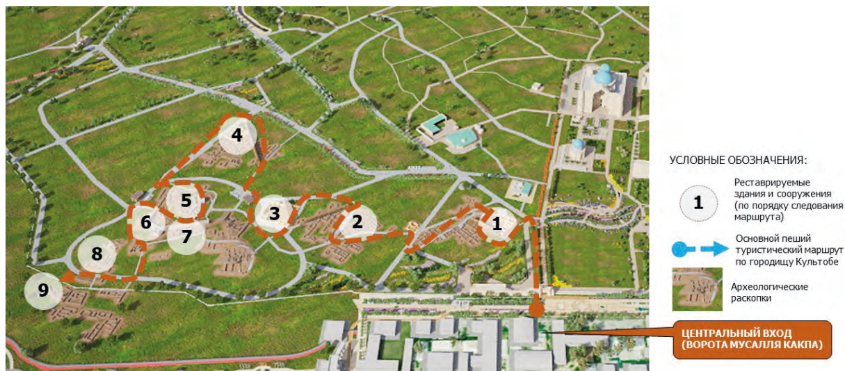
Рисунок 2. Общий вид 3D визуализированного туристического маршрута по городищу Культобе

К примеру, жилой дом ремесленника XVII–XVIII вв. по всем признакам принадлежал типичной семье потомственного ремесленника, который располагался на главной торговой улице Культобе и, видимо, там же он и продавал свои изделия. Об этом свидетельствуют расположение дома и атрибуты убранства и интерьера, реконструированные по сохранившимся археологическим фрагментам и архивным материалам. Объемно планировочное решение характеризуется сложным планом, сочетающим жилые и производственные помещения, перекрытые когда-то деревянными балками, по которым, скорее всего, устраивалось глина-саманное покрытие кровли.